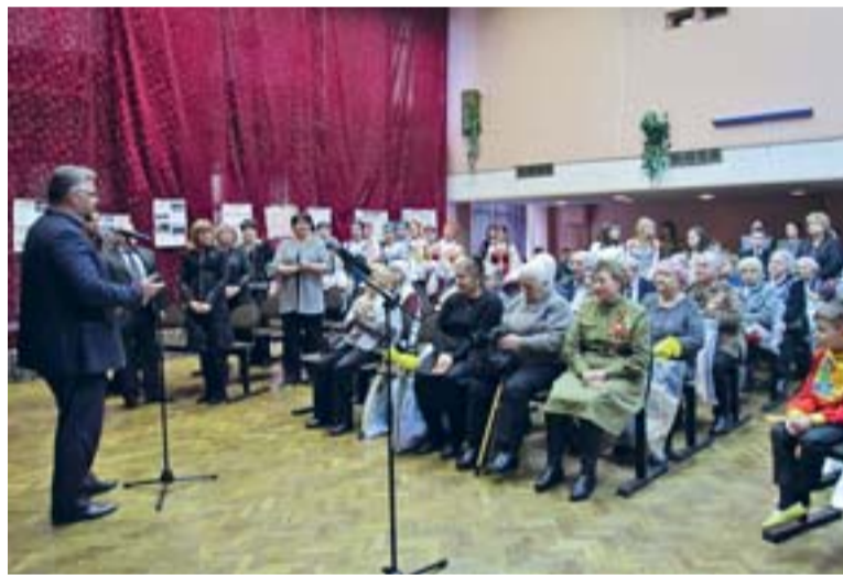
Приветственное слово директора школы

товленный учащимися и воспитанниками дошкольных отделений общеобразовательного учреждения. Пожалуй, самым эмоциональным, трепетным и поистине святым не только для ветеранов, но и для всех участников празднования этого дня стало возложение цветов к памятнику узникам фашизма, установленному во дворе