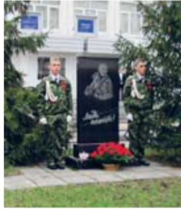
Памятник во дворе школы