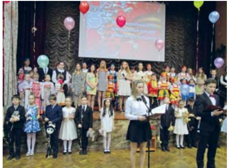
Концерт «Вам, ветераны!»

Фашистская Германия вела войну с СССР в расчёте на полное его уничтожение. Эта преступная цель проявилась и в особо жестоком обращении гитлеровцев с советскими военнопленными. За годы