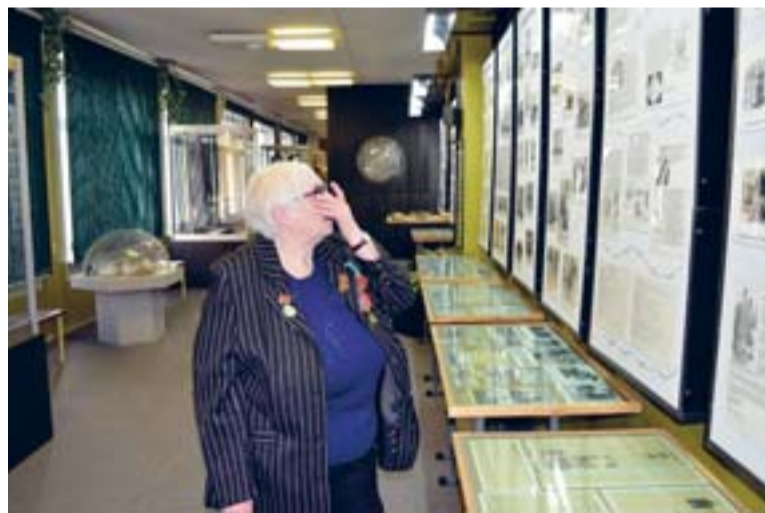
В школьном музее

нашей школы в 2010 году. Это добрая память о тех невинных людях, которые погибли в лагерях. Эта та память, которая живёт в наших сердцах и будет жить в сердцах наших детей. Будущее поколение должно знать о немеркнущем подвиге и неслыханных страданиях, хранить память о том великом противостоянии, которое сохранило непреклонную веру людей в нашу Победу.