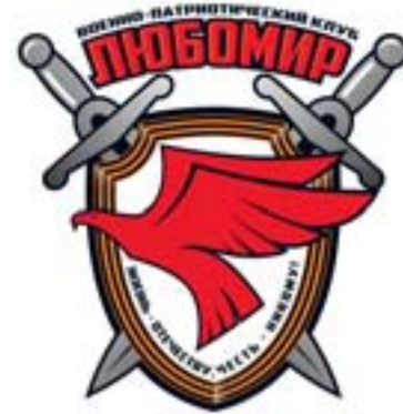
Эмблема военно-патриотического клуба «Любомир»

классов; индивидуальный психологический подход к каждому из воспитанников; особый педагогический состав, состоящий из офицеров-воспитателей.