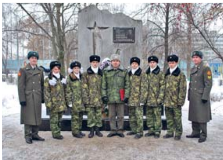
В День защитника Отечества

Не удивительно, что в школе с такими глубокими традициями