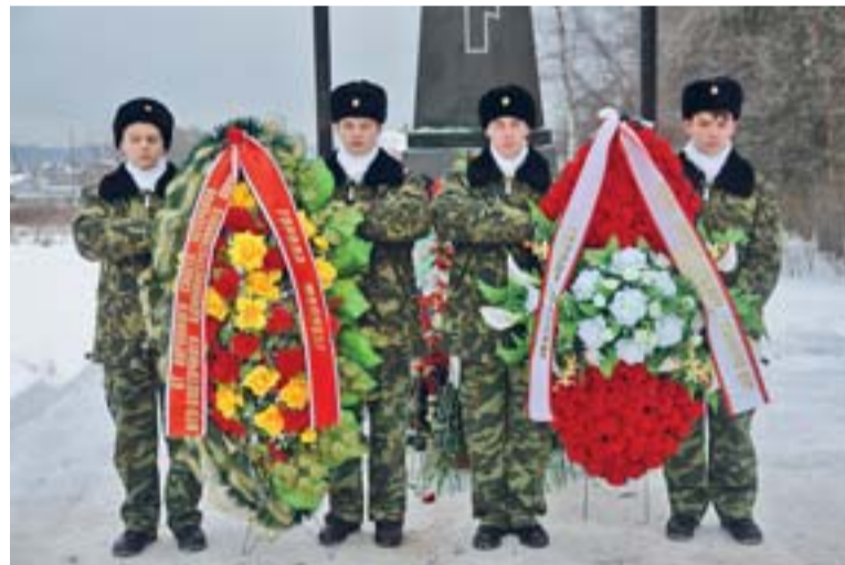
Возложение венков в музее танка Т-34

Чувство ответственности, которое развивается в воспитанниках кадетского класса за годы обучения, является необходимым не только для будущего офицера и для настоящего мужчины, но – более широко – для успешного современного человека, обладающего такими качествами, как высокая образованность, собранность,