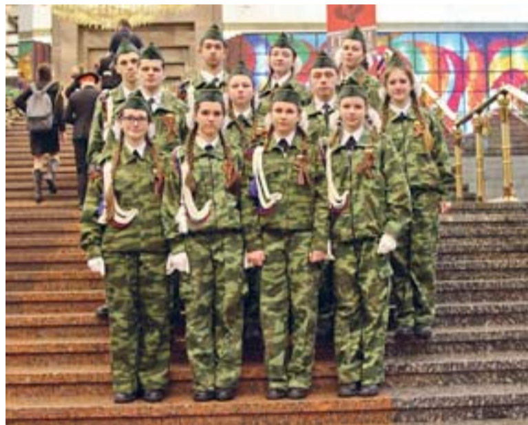
В музее на Поклонной горе

В смотре-конкурсе по патриотическому воспитанию «Кубок Героев» команда школы № 1877 завоевала