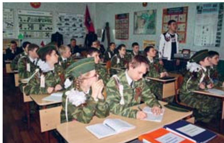
Воспитанники клуба на занятиях

выдержка, коммуникабельность. С другой стороны, обучение в кадетском классе – это не только возможность получить качественное образование и гражданское воспитание, но и серьёзное противостояние пагубному влиянию улицы. Кадетское образование дисциплинирует и ограждает от отрицательных сторон современного общества. А потому подобная учебная программа способна оказать благотворное влияние на всестороннее